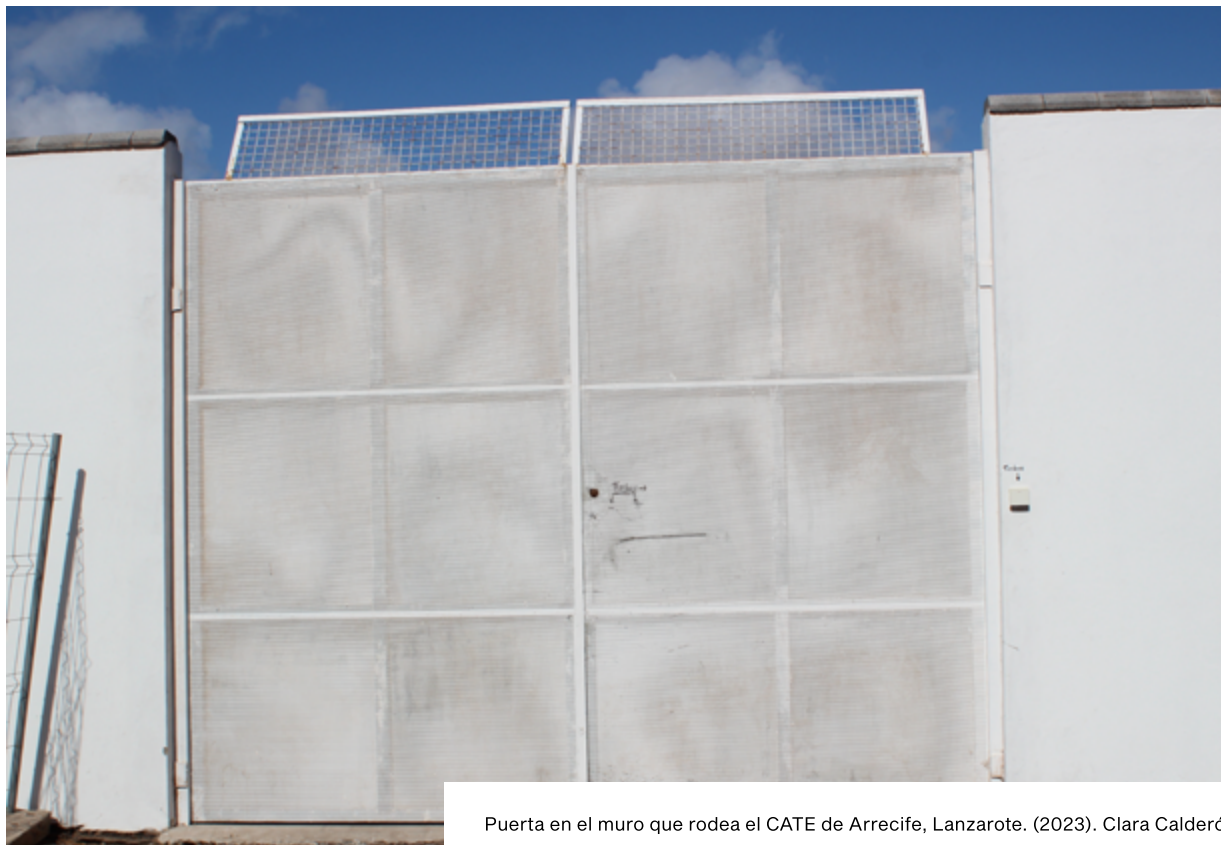
Puerta en el muro que rodea el CATE de Arrecife, Lanzarote. (2023). Clara Calderó.

Las personas migrantes que entran al territorio por vías irregulares son sistemáticamente privadas de libertad 41 en los CATE donde permanecen detenidas un máximo de 72 horas.