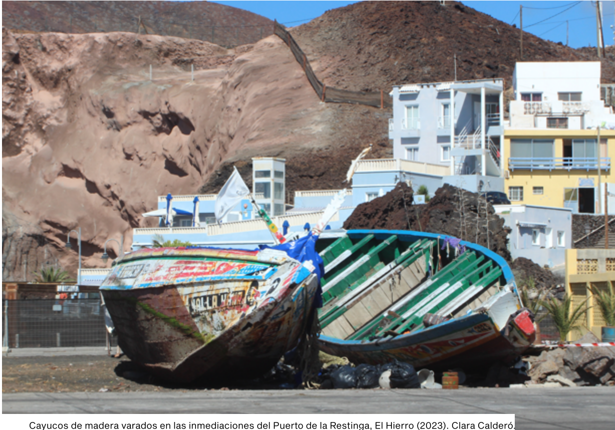
Cayucos de madera varados en las inmediaciones del Puerto de la Restinga, El Hierro (2023). Clara Calderó.

Los traslados de personas desde Canarias a la península se han facilitado con respecto al funcionamiento durante el 2020. Esto ha permitido el flujo de personas adultas, de manera que no se han quedado atrapadas en las islas. Sin embargo, la rapidez en los traslados también ha generado deficiencias en la detección de casos de vulnerabilidad y el acceso al procedimiento de asilo. Además, ya a finales de 2022, se introdujeron modificaciones en el sistema de atención humanitaria por parte del Ministerio de Inclusión, reduciendo los tiempos de asistencia de tres meses a un solo mes 26 . Estas modificaciones se complementaron con otras nuevas, reduciendo los criterios de vulnerabilidad a los solicitantes de protección internacional y limitando la posibilidad de solicitar prórrogas y otras medidas de protección internacional 27 . Teniendo en cuenta la imposibilidad de acceder a citas para formalizar la solicitud en la península, se señala este punto como grave en lo relativo al acceso a derechos a la protección internacional. Muchas de estas medidas van ligadas a la situación de emergencia declarada por la Secretaría de Estado de Migraciones el 13 octubre de 2023 28 . Es importante destacar la falta de claridad en el establecimiento de medidas de acogida y atención, especialmente en el 2023. La emisión de modificaciones consecutivas ha generado una situación de inestabilidad y confusión que contribuye a la falta de garantías de acceso a derechos.