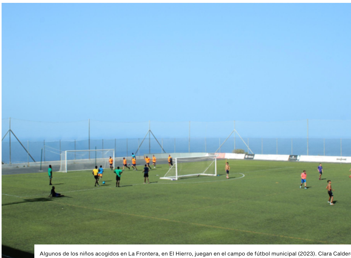
Algunos de los niños acogidos en La Frontera, en El Hierro, juegan en el campo de fútbol municipal (2023). Clara Calderó.

En relación con la detención de infancia en los CATE, Amnistía Internacional tiene testimonios de diversas personas, muchas de ellas menores de edad, que denuncian que la policía les quitó todos sus efectos personales a la llegada, incluyendo algunos amuletos, así como teléfonos móviles, metiéndolos en algunas ocasiones en bolsas sin ningún tipo de identificación y complicando así la devolución de estos efectos personales por parte de las organizaciones que se encargan de la acogida de estas personas.