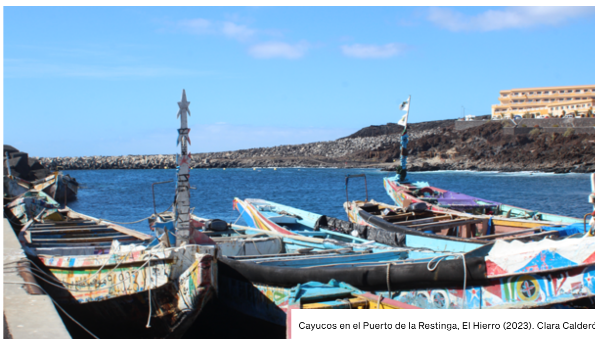
Cayucos en el Puerto de la Restinga, El Hierro (2023). Clara Calderó.