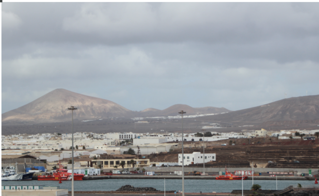
Puerto de Arrecife, Lanzarote. Pueden verse dos embarcaciones de Salvamento Marítimo y el módulo de Cruz Roja (2023). Clara Calderó

La organización y las instalaciones que se ponen a disposición de la gestión de las llegadas varían de puerto a puerto y entre provincias e islas. En general, en la actualidad, los puertos canarios destinados a la recepción de personas migrantes que llegan por mar cuentan con instalaciones de la Cruz Roja que consisten en carpas o prefabricados donde se realiza la primera toma de contacto. Este primer contacto suele consistir en una primera atención humanitaria (alimentos, hidratación, ropa de cambio y abrigo, identificación por pulseras, etc), apoyo a la traducción y mediación (entrevista personal, y atención sanitaria si dispone de personal sanitario (traje, derivaciones, etc).