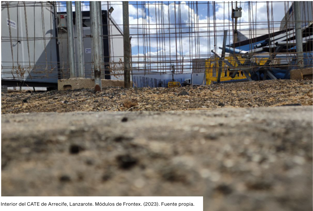
Interior del CATE de Arrecife, Lanzarote. Módulos de Frontex. (2023).

En Lanzarote , el CATE tiene una capacidad de 200 personas. Es un conjunto de carpas con literas y módulos prefabricados para la atención policial, situados en un descampado en la parte trasera de la comisaría de Policía Nacional, rodeado por un muro de unos 3 metros de altura. Desde agosto, el centro se ha colapsado varias veces, habiendo sido necesario instalar carpas auxiliares en el muelle de Puerto Naos en las