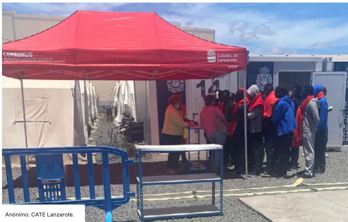
Anónimo. CATE Lanzarote.

En Lanzarote , se ha detectado al menos un caso donde la policía ha impedido la entrada al CATE de un trabajador de un centro de emergencia que estaba acompañado a mujeres para la reseña por haber preguntado por qué las personas esperaban al sol y por solicitar una silla para una mujer que estaba esperando para ser reseñada y se encontraba mal. Esta mujer había realizado una travesía en patera el día anterior. Este mismo trabajador señaló que se estaban realizando las asistencias letradas de las personas que acaban de llegar bajo el sol, como se observa en la foto, siendo claramente fácil realizarlas en la sombra. En la foto se observa como la letrada y la intérprete se encuentran bajo la sombra de la carpa mientras las personas supervivientes se agolpan al sol.