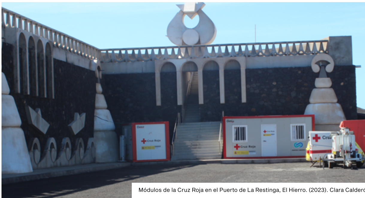
Módulos de la Cruz Roja en el Puerto de La Restinga, El Hierro. (2023). Clara Calderó.

protección internacional y colectivo LGTBQI+, entre otras), aunque quien realiza la reseña es la PN. Bajo el nuevo concierto con el Ministerio de Inclusión, Seguridad Social y Migraciones, Cruz Roja hace llegar los datos recogidos al Ministerio, y en base a esta información se llevan a cabo las derivaciones tras la detención en CATE.