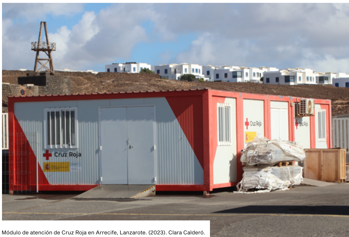
Módulo de atención de Cruz Roja en Arrecife, Lanzarote. (2023). Clara Calderó.

En el equipo de respuesta inmediata que despliega Cruz Roja no se garantiza la presencia de personal con conocimientos médicos o de enfermería y tampoco hay personal especializado en infancia. Es necesario esclarecer y protocolizar la responsabilidad y funciones específicas de cada interviniente , Cruz Roja, el SUC y el Sistema Canario de Salud en el momento del desembarco, dado que se genera un vacío en la garantía de presencia de personal sanitario profesional, lo cual podría incurrir en una vulneración del derecho a la salud y a la vida. En todo caso, sería conveniente en el futuro la participación en estos dispositivos de médicos y médicas del sistema público de salud, y/o asegurar que puedan realizar visitas individualizadas en las horas siguientes al desembarco.