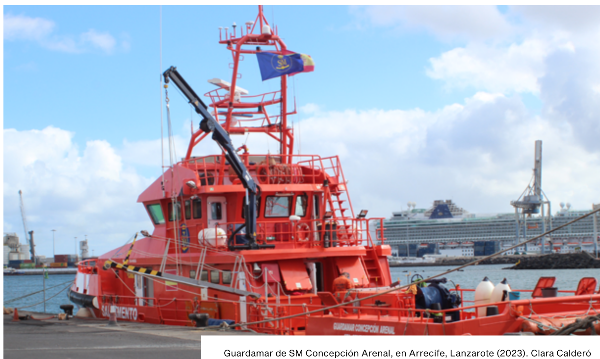
Guardamar de SM Concepción Arenal, en Arrecife, Lanzarote (2023). Clara Calderó

Tras la detección de una embarcación, si el CCRC avisa a Salvamento Marítimo, se informa también al 112, que a su vez manda una alerta a Cruz Roja (Servicio de Emergencias) y al Sistema de Urgencias Canario (SUC, en adelante). El SUC decide que recursos enviar a nivel provincial, según las indicaciones de Salvamento Marítimo: puede mandar al muelle en el que se realiza el desembarco Soporte Vital Básico, que consiste en una ambulancia sin personal médico ni enfermero/a o Soporte Vital Avanzado, con personal médico o de enfermería, que tiene los medios para atender in situ una urgencia y hacer un transporte en caso de que exista peligro para la vida. A su vez, Cruz Roja envía un Equipo de Respuesta Inmediata en Emergencia de Ayuda Humanitaria a Inmigrantes (ERIE). En 2023, esta primera atención de Cruz Roja ha pasado a llamarse Primera Respuesta de Emergencia para Población Inmigrante (PREPI).